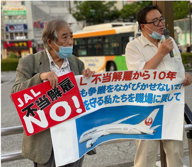
JAL争議の早期解決を訴える

JAL争議 都内6駅で 3カ月ぶり駅頭宣伝再開 JAL争議の大衆行動は、コロナ禍で中断していたが、JAL株主総会行動(品川・19日)から、大衆行動を再開した。JAL争議は、2年前に当時の社長が「早期の解決」を述べたものの、165名の解雇者に対する手立ては何もしない。 不当解雇から10年を迎える12月31日を節目に、JAL争議解決を図ることを目指して、6月29日、3ヶ月ぶりに都内6駅行動(錦糸町駅・品川駅・練馬駅・高田馬場駅・立川駅・有楽町マリオン前)が再開した。JR錦糸町駅北口では、18時より細