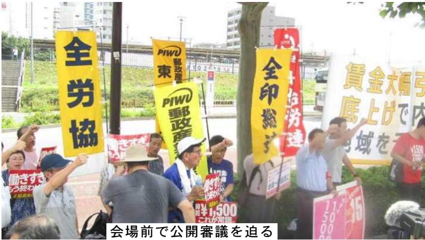
会場前で公開審議を迫る