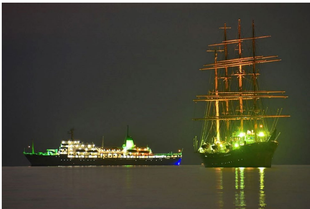
鏡が浦（館山湾の別名）に浮かぶ日本丸などの夜景