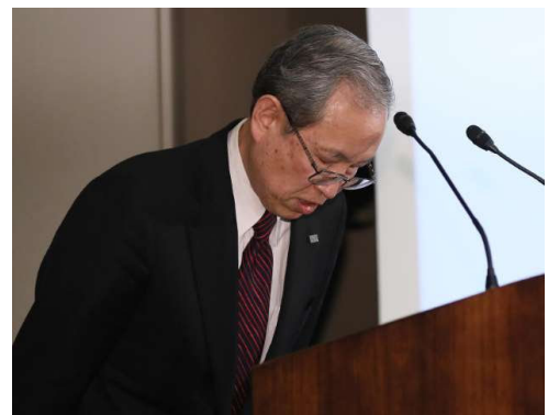
決算発表再延期を発表する記者会見で頭を下げる東芝の綱川智社長