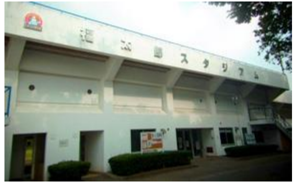
（福太郎スタジアム）

今回の改修では、公認競技場として、中学生の競技会を市内で開催できるようにするため、また、インフィールドを通年で快適に利用できるように人工芝に変えるなどの改修が行われていました。