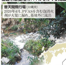
在日米軍基地のPFASをめぐる問題

普天間飛行場（沖縄県） 2020年4月、PFASを含む泡消火剤が大量に漏れ、基地外に流出 三沢基地（青森県） 22年1月、PFASを含む水が基地外に流出 横田基地（東京都） 10～12年、PFASを含む泡消火剤が3回流出。米側は「基地外への流出はない」と説明 厚木基地（神奈川県） 22年9月、PFASを含む泡消火剤が基地内の川に流出 横須賀基地（神奈川県） 22年6月、基地の排水からPFASを検出 嘉手納基地（沖縄県） 16～23年、周辺で高濃度のPFASをたびたび検出