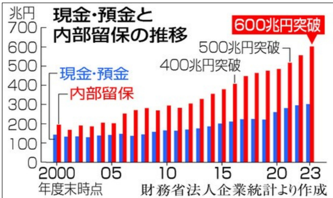
(日刊工業新聞・11月30日)

年代に最低賃金を1500円」の要請をしましたが、実効性はありません。一方、連合は来春闘の賃上げの